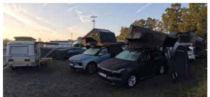
E-Auto-Camping: Vollelektrische Camper können wie in Hamm auf, in und neben dem E-Auto zu übernachten.

Am 19. September besteht ab 8.00 Uhr die Möglichkeit an einem Frühstücksbufett unter Vorlage des Campingtickets teilzunehmen.