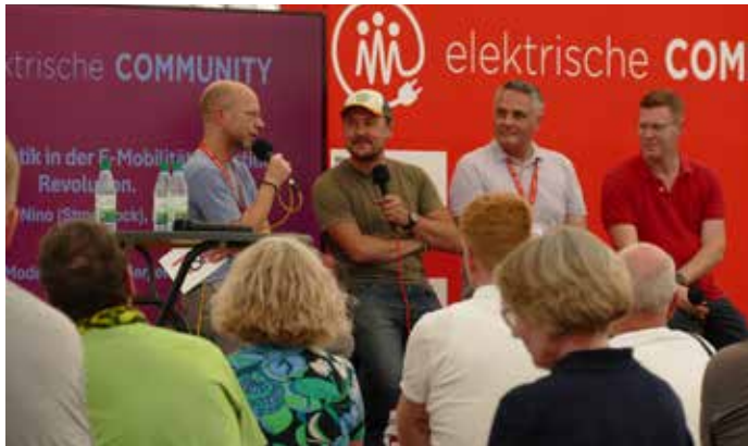
Diskussionsprogramm in Fulda 2025

Das Bühnenprogramm mit Diskussionsrunden zu Elektromobilitäts- und Energie-Themen mit ausgewiesenen Expert:innen findet von 10.00 bis 19.00 Uhr statt.