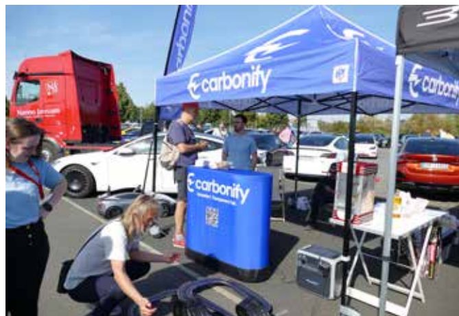
Der Sponser Carbonify bei der Zukunftsmesse in Fulda 2025.

Sponsoren, also Unternehmen, die gegenüber einem klassischen Messeauftritt besonders auffällig Flagge zeigen wollen können schon von Anfang an im Kontext der Ankündigung des Events Beachtung finden.