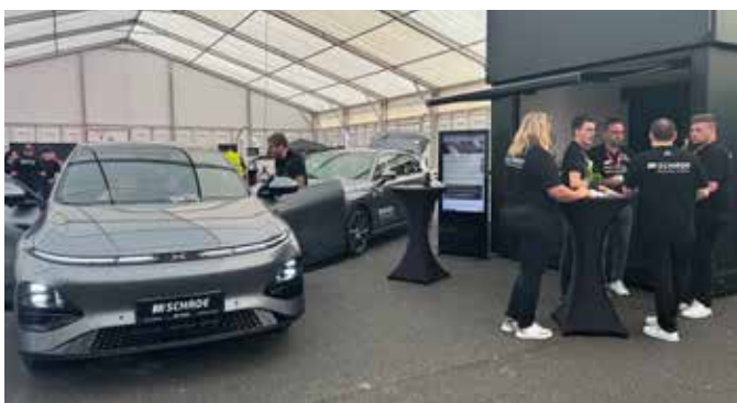
Schade GmbH & Co. KG präsentierte in Fulda Hyundai und XPeng.

Der Rahmen des elektrische COMMUNITY Events ist kostenintensiv. Ein Zelt wie das 2025 zu mieten kostet 40.000 Euro. Dazu kommen Geländemiete, Wasser- und Strom-Installationen und viele weitere kleine, mittlere und größere Ausgaben.