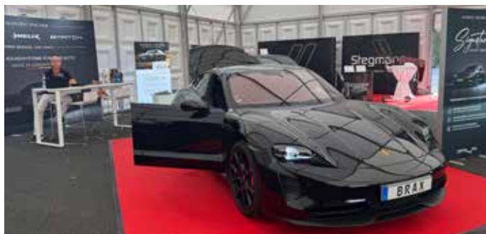
Austeller Audiotec Fischer und im Hintergrund Stegmann-Lack bei der Zukunftsmesse 2025 in Fulda.

Am Vorabend des Hauptevents, am 18. September wird die E-Zukunftsmesse zu E-Mobilität & erneuerbaren Energien um 18.00 Uhr offiziell eröffnet. Sie wird bis 20.00 Uhr für einen ersten Messerundgang zugänglich sein.