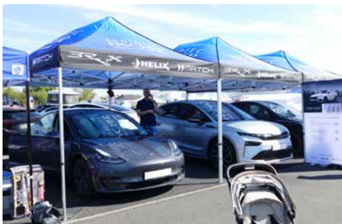
Speaker City GmbH präsentierte sich auf dem Außengelände.

Mit Eintrittsgeldern allein lässt sich das nicht finanzieren. Sponsoren und Aussteller tragen im Wesentlichen die Kosten.