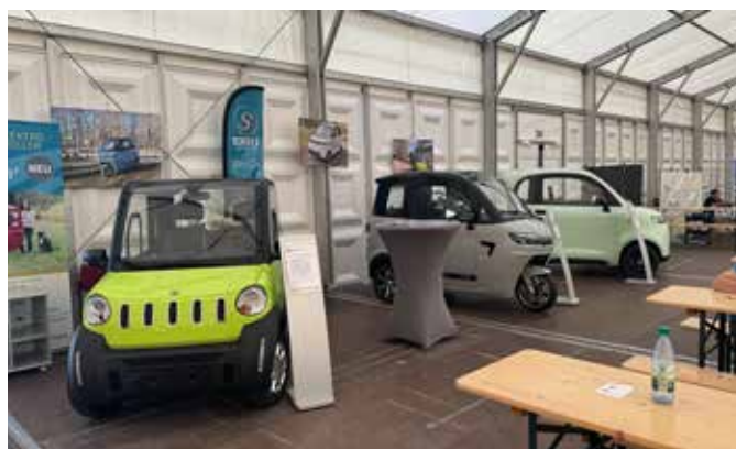
Scheelen Elektromobile mit vollelektrischen Kleinfahrzeugen in Fulda.

Sponsoren, also Unternehmen, die gegenüber einem klassischen Messeauftritt besonders auffällig Flagge zeigen wollen können schon von Anfang an im Kontext der Ankündigung des Events Beachtung finden.