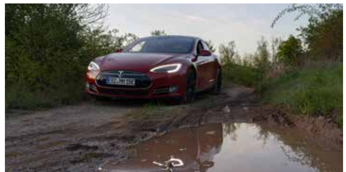
Offroad-Gelände nutzung in Fulda 2025

Das gilt auch für zahlreiche Praktiker:innen der E-Mobilität, die gerne über eigene Erfahrung berichten und an ihren privaten Fahrzeugen Interessierten Dinge erklären. Es handelt sich um ein Mitmach-Event der Community. Markenunabhängig, nachhaltig und mit Spaß dabei.