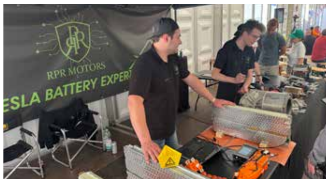
RPR Motors in Fulda 2025

Aussteller, die sich 2026 im Rahmen der E-Zukunftsmesse präsentieren wollen, können mit ihren Standgebühren einen Beitrag leisten.