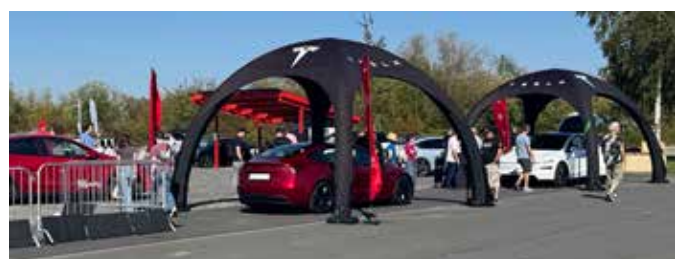
Tesla im Außengelände bei der E-Zukunftsmesse 2025