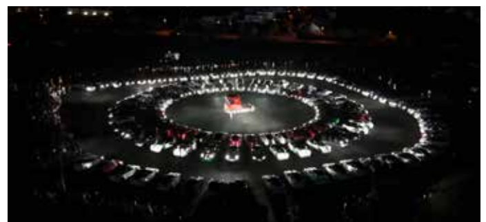
Tesla-Lightshow 2025 in Fulda

Um 20.00 Uhr steigt eine große Tesla-Lightshow und ab 20.30 Uhr ein weiteres E-Mobilitäts-Barbeque .