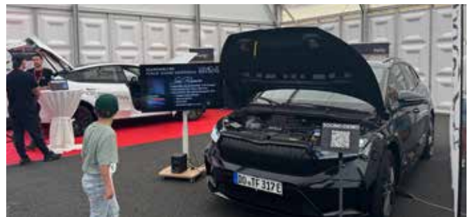
Die Soundexperten von Vehicle SoundLab ohne Hallenboden 2025