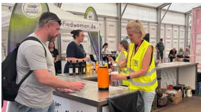
Getränke und Tee- und Kaffeeflat in Fulda 2025

Für das leibliche Wohl sorgen Streetfood-Angebote. Es wird wieder eine Tee- & Kaffee-Flatrate geben.