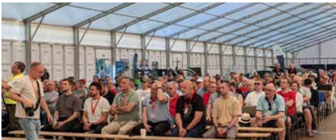
Publikum in Fulda 2025

Am Rande des Geländes bieten Hersteller von Elektrofahrzeugen Probefahrten an und stehen Interessierten beratend zur Verfügung. Auch das Offroad-Gelände kann befahren werden