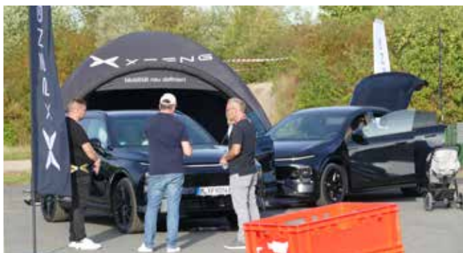
Der chinesische Fahrzeughersteller XPeng der in Fulda als Sponsor den Besuchern Fahrzeuge präsentierte und Probefahrten ermöglichte.

Der Rahmen des elektrische COMMUNITY Events ist kostenintensiv. Ein Zelt wie das 2025 zu mieten kostet 40.000 Euro. Dazu kommen Geländemiete, Wasser- und Strom-Installationen und viele weitere kleine, mittlere und größere Ausgaben.