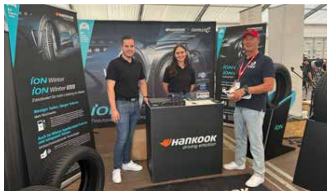
Reifenhersteller Hankook mit Hallenboden 2025