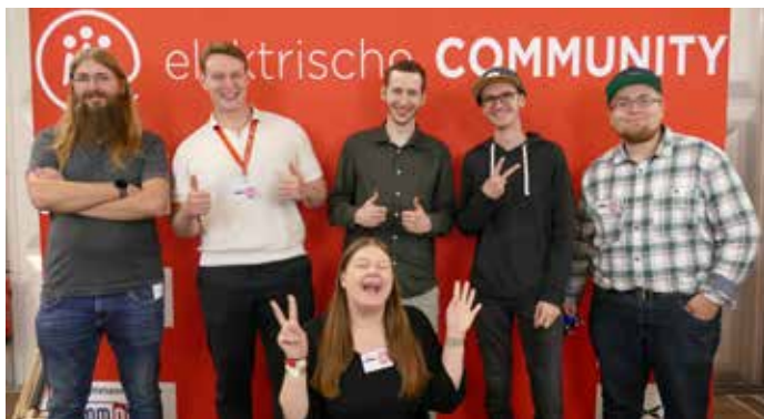
Meet&Greets: Vor der Fotowand in Fulda.

Ganztägig können vor einer Fotowand in Meet & Greets Content Creator getroffen werden.