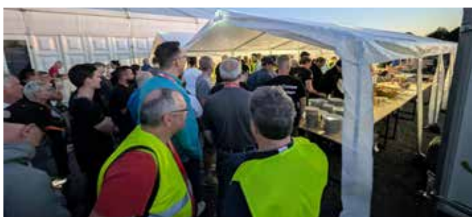
E-Mobilitäts-Barbeque 2025 in Fulda .

Vernetzung ist ausdrücklich erwünscht und Ziel dieses Veranstaltungsparts.