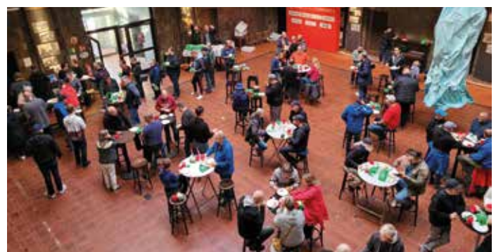
Frühstück: Wie 2023 in Hamm werden die E-Auto-Camper auch 2026 in Fulda mit einem hochwertigen Frühstück versorgt.

E-Auto-Camping am Folgeabend und Teilnahme am Frühstücksbufett ist auch am Sonntagmorgen unter gleichen Bedingungen möglich.